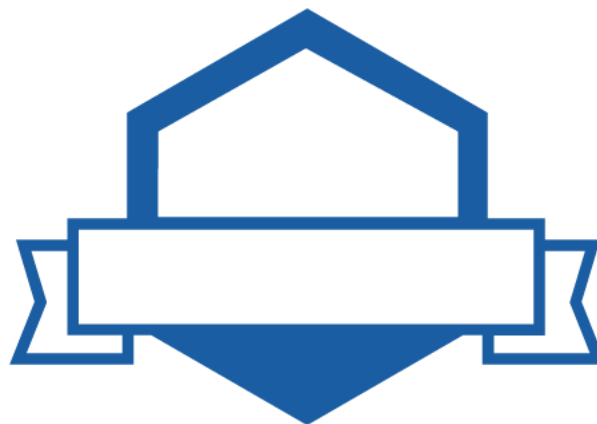
MICRO-CREDENZIALI E OPEN BADGE